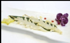
156. SPIEDINI DI CIUFFI GRIGLIATI

spiedini di ciuffi alla griglia conditi con salsa teriyaki