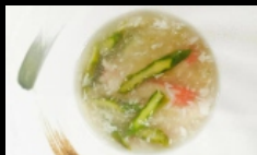
163. GAMBERI CON ASPARAGI gamberetti saltati con asparagi € 5.00