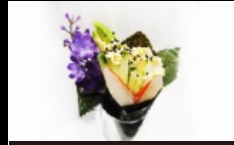
090. TEMAKI CALIFORNIA farcito con granchio, avocado, cetrioli, maionese e sesamo