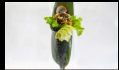
087. TEMAKI MIURA farcito con salmone cotto, insalata, sesamo e salsa teriyaki