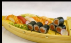
104. BARCA PICCOLA nigiri, hossomaki € 12.00