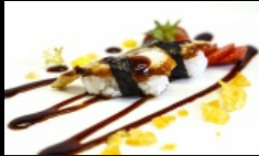
067A. NIGIRI ANGUILLA