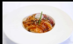
103. CHIRASHI MISTO fettine di pesce misto su letto di riso, sesamo e salsa teriyaki € 10.00