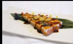
155. SALMONE ALLA GRIGLIA

salmone griglia conditi con salsa teriyaki