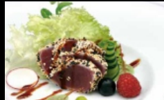
117. TATAKI TONNO fettine di tonno con sesamo alla piastra conditi con salsa teriyaki € 12.00