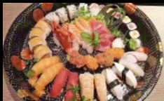
202. SUSHI BOX MEDIUM

12 sashimi, 10 nigiri, 4 gunkan, 12 maki