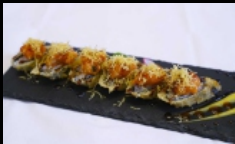
062. HOSSOMAKI FRITTI

piccoli rotoli di riso fritti con salmone, guarnito con tartare di salmone piccante e salsa teriyaki, kataifi