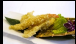
152. TEMPURA MORIAWASE