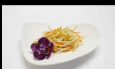
183. GERMOGLI DI SOIA germogli di soia saltato € 3.50