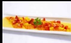
109. CARPACCIO FRUTTI salmone scottato con frutti stagione, salsa mango € 12.00