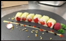
077A. HOSO SOYA FRAGOLA foglia sola, riso, fragola