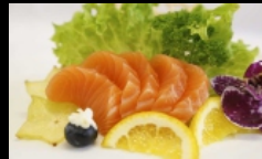
100. SASHIMI SAKE fettine di salmone € 10.00