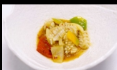
179. SEPIE IN SALSA PICCANTE seppie saltate con salsa piccante € 4.50