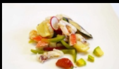
016. TAKO SALAD

insalata frutti di mare con gamberetti, surimi, seppia, cozze