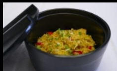
125. RISO TAMI riso saltato con pollo, funghi, cipolle, peperoni, uova, leggermente piccante € 6.00