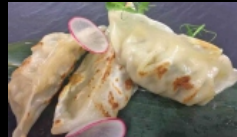
011. RAVIOLI DI POLLO

ravioli con ripieno di carne di pollo e verdure misto a piastra