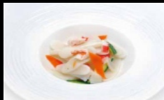
138. GNOCCHI DI RISO gnocchi di riso saltati con frutti di mare e verdure misto € 5.00