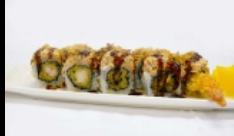
034. URAMAKI CHIPS ROLL

rolli di riso farciti con gamberi cotti, guarniti con salmone,scotto,cipolla croccate, conditi con salsa teriyaki