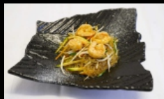
133. SPAGHETTI DI SOIA CON GAMBERI spaghetti di soia saltati con gamberi e verdure misto € 4.00