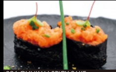
096. GUNKAN SPICY SAKE con alghe nori, guarniti con tartare di salmone, tobiko, maionese e salsa piccante