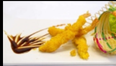
146. GAMBERI FRITTI