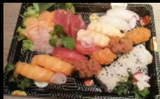
201. SUSHI BOX