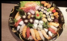
203. SUSHI BOX BIG

16 sashimi, 15 nigiri, 28 maki, 6 gunkan