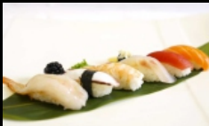
074. NIGIRI MISTO