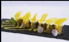
060. HOSSOMAKI FRITTI MANGO

piccoli rotoli di riso fritti con salmone, guarnito con philadelphia, mango e salsa al mango