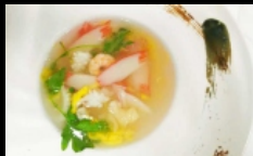
024. ZUPPA FRUTTI DI MARE