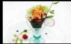
086. TEMAKI SPICY MAGURO farcito con tonno tritato, insalata, maionese e salsa piccante e chips