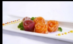
107. CARPACCIO MISTO fettine di salmone, tonno, branzino con salsa ponzu e sesamo € 12.00