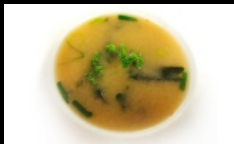
023. MISO SHIRO

zuppa di miso con alghe, tofu e cipollino