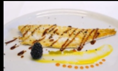
156A. BRANZINO ALLA GRIGLIA

branzino alla griglia condito con salsa teriyaki