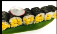
084. HOSOMAKI MAIS farcito con mais