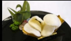
008. NUVOLE DI DRAGO

croccanti chips di farina di tapioca e frutti di mare