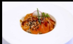
102. CHIRASHI SAKEDON fettine di salmone su letto di riso, sesamo e salsa teriyaki € 9.00