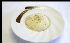
120. RISO BIANCO riso bianco € 2.00