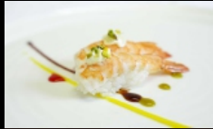
068. NIGIRI EBI