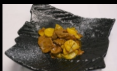
169. MANZO CON PATATE bocconcini di manzo saltati con patate € 5.50