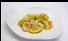
177. GAMBERI AL LIMONE gamberetti saltati con limone e salsa al limone € 5.00