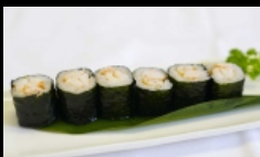
079. HOSSOMAKI EBI