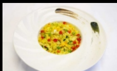
118. RISO CON CURRY riso saltato con curry € 3.50