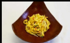
129. SPAGHETTI CON VERDURE spaghetti saltati con verdure misto € 3.50