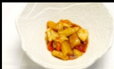
168. POLLO IN AGRODOLCE petto di pollo croccante con salsa agrodolce € 4.00