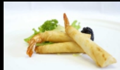
002. INVOLTINO GAMBERI

croccanti involtini fritti di pasta con un gustoso ripieno di gamberi