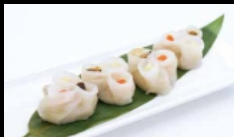
012. RAVIOLI DI GAMBERI AL VAPORE