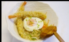
142. RAMEN CON TEMPURA pasta ramen con tempura € 6.50