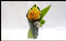
084. TEMAKI SAKE AVOCADO farcito con salmone, avocado e sesamo