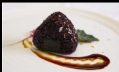
076. ONIGIRI VENERE