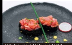
097. GUNKAN SPICY MAGURO con alghe nori, guarniti con tartare di tonno, tobiko, maionese e salsa piccante