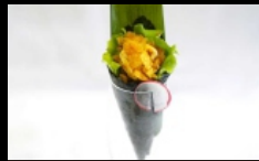
085. TEMAKI SPICY SAKE farcito con salmone tritato, insalata, maionese e salsa piccante e chips