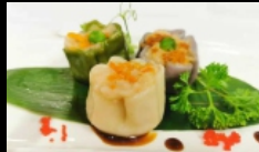
010. SHAO MAI

ravioli con ripieno di carne di maiale e uova gamberetti