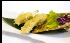
150. YASAI TEMPURA