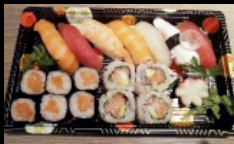
200. SUSHI MISTO