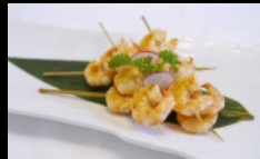
157. SPIEDINI GAMBERI GRIGLIATI

spiedini di gamberi griglia conditi con salsa teriyaki