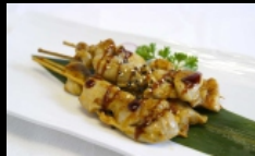
158. SPIEDINI POLLO GRIGLIATI

spiedini di pollo griglia conditi con salsa teriyaki