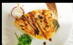
090. SAKE IMOYAK .... € 4.80