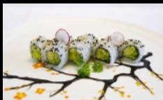
027. URAMAKI VEGETARIANO

rolli di riso farciti con avocado,insalata, cetrioli e sesamo