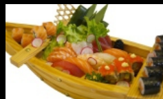
105. BARCA MEDIA sashimi misto, nigiri, hossomaki, uramaki € 28.00