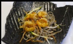
136. EBI YAKI SOBA spaghetti di grano saraceno saltati con verdure misto, uova e gamberi, guarnito con granelle di arachidi € 4.50