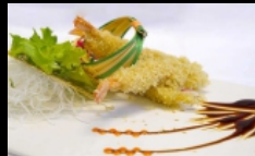
149. EBI TEMPURA