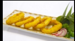
147. CALAMARI FRITTI