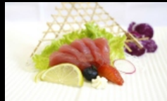
099. SASHIMI TONNO fettine di tonno € 12.00