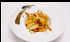
176. GAMBERI SALE E PEPE gamberetti saltati con sale e pepe € 5.50