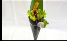
089. TEMAKI EBII farcito con gamberi fritti, insalata, sesamo e salsa teriyaki