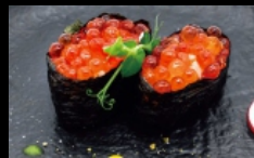
093. GUNKAN IKURA con alghe nori, guarniti con uova di salmone