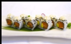
028. URAMAKI SAKE AVOC. PHIL.

rolli di riso farciti con salmone,avocado, sesamo,philadelphia