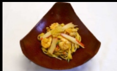
130. SPAGHETTI CON FRUTTI DI MARE spaghetti saltati con frutti di mare, verdure e uova € 4.50