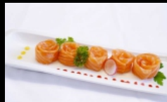
106. CARPACCIO SALMONE fettine di salmone con salsa ponzu e sesamo € 10.00