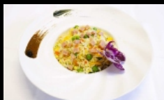
121. RISO CANTONESE riso saltato con piselli, prosciutto cotto e uova € 3.50