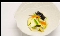
180. SEPIE CON VERDURE seppie saltate con verdure misto € 4.50