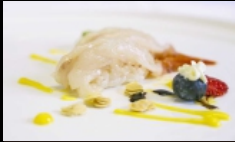
069. NIGIRI AMAEBI