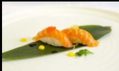
064. NIGIRI SAKE