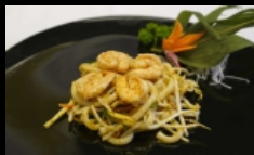
134. EBI YAKI UDON spaghetti di farina di grano tenero saltati con gamberi e verdure, guarnito con granelle di arachidi € 5.00