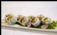
030. URAMAKI MIXED FISH

rolli di riso farciti con avocado,pesce misto, maionese,sesamo