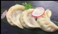
009. RAVIOLI DI CARNE

ravioli con ripieno di carne di maiale e verdure misto