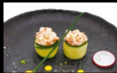
092. GUNKAN ZUCCHINA avvolto con zucchine tagliata sottile e guarniti con tartare di gamberi e tobiko, salsa piccante e maionese