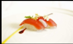
065. NIGIRI MAGURO