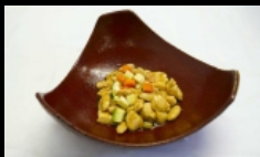
164. POLLO ALLE MANDORLE petto di pollo saltato con mandorle, carote € 4.00