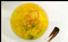
025. ZUPPA DI MAIS

zuppa di mais con pollo,uova e cipollino