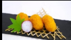
144. CHELE DI GRANCHIO