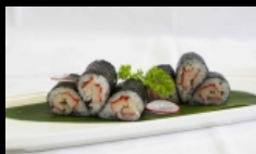
078. HOSSOMAKI GRANCHIO