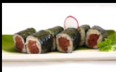
081. HOSOMAKI TONNO farcito con tonno