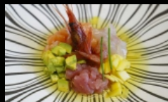
114. TARTARE SPECIAL MISTO tartare di salmone, branzino, tonno, avocado, mango, pistacchio e salsa ponzu € 10.00