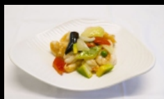
174. GAMBERI 5 COLORI gamberetti saltati con 5 verdure diverse € 5.00