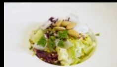
019. INSALATA MISTA