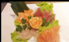
204. SASHIMI MIX