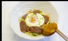
141. RAMEN CON MANZO pasta ramen con manzo € 5.50