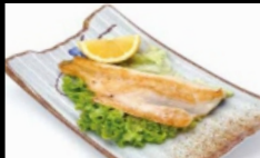
160. PESCE BIANCO

pesce bianco griglia conditi con salsa teriyaki