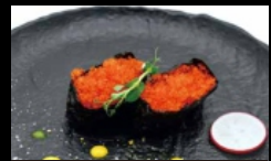
094. GUNKAN TOBIKO con alghe nori, guarniti con uova di pesce volante