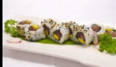
032. URAMAKI MAGURO AVOCADO

rolli di riso farciti con tonno e avocado, sesamo