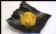
126. SPAGHETTI DI RISO CON VERDURE spaghetti di riso saltati con verdure misto € 3.50