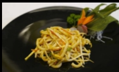
135. KAISEN YAKI UDON spaghetti di farina di grano tenero saltati con verdure, guarnito con granelle di arachidi € 4.00