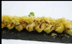
063. URAMAKI FRITTI

rotolo di riso fritto farcito con salmone, avocado, philadelphia e alghe nori, conditi con salsa teriyaki e kataifi