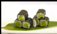
080. HOSSOMAKI CETRIOLI