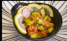
110. TARTARE DI SAKE AVOCADO tartare di salmone, avocado, sesamo e salsa ponzu € 5.00