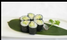
077. HOSSOMAKI AVOCADO