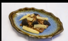
173. MANZO CON FUNGHI E BAMBU bocconcini di manzo saltato con funghi e bambù € 5.00