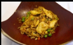
119. RISO CON POLLO riso saltato con pollo € 4.00