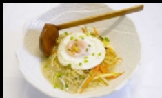
139. RAMEN pasta ramen brodo con alghe, surimi, naruto € 6.00