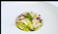
020. INSALATA GAMBERI ARACHIDI