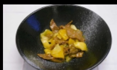
172. MANZO THAI bocconcini di manzo saltato con verdure e peperoncino € 5.00