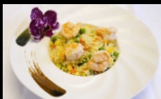
123. RISO CON GAMBERETTI riso saltato con gamberi, carote, zucchine, erba cipollina e uova € 4.00