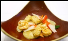
140. GNOCCHI FRUTTI DI MARE gnocchi di riso saltati con frutti di mare € 3.50