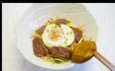
122. RAMEN UDON MANZO ramen con udon e manzo € 5.50