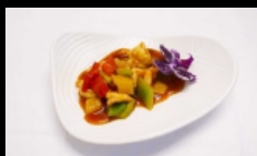
175. GAMBERI THAI gamberetti saltati con salsa piccante € 5.00