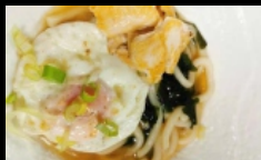
128. RAMEN UDON POLLO ramen con udon e pollo € 6.50