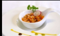
111. TARTARE DI SAKE tartare di salmone, sesamo e salsa ponzu € 6.00