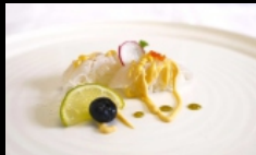
072. NIGIRI SUZUKI SCOTTATO

bocconcini di riso con branzino scottato, scaglie di pistacchio, maionese e salsa piccante