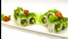
033. URAMAKI WAKAME

rolli di riso farciti con alga wakame, avocado e sesamo