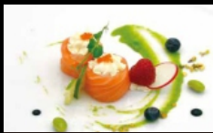
091. GUNKAN PHILADELPHIA avvolto con fettine di salmone, farcito con philadelphia, guarnito con tobiko