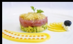
115. TARTARE SPECIAL TONNO tartare di tonno, avocado, salsa piccante katalifi con salsa ponzu € 10.00