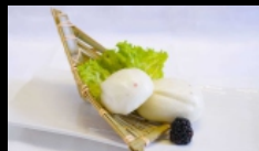
021. CONIGLIO DI PANE CINESE