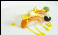
071. NIGIRI SAKE MANGO