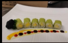
077B. HOSO SOYA MANGO foglia sola, riso, mango