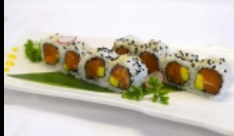
031. URAMAKI SAKE AVOCADO

rolli di riso farciti con salmone e avocado