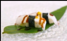
066. NIGIRI POLPO