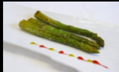
154A. ASPARAGI ALLA GRIGLIA