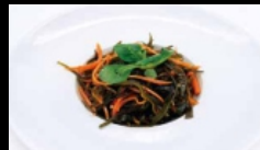
015. ALGHE CINESI