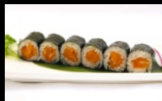
082. HOSOMAKI SAKE farcito con salmone