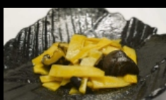
182. FUNGHI E BAMBU funghi shitate e bambù saltato € 4.00