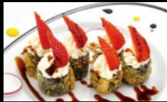
061. HOSSOMAKI FRITTI FRUTTA

piccoli rotoli di riso fritti con salmone, guarnito con philadelphia, frutta fresche e salsa teriyaki