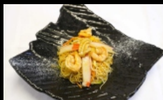
127. SPAGHETTI DI RISO CON GAMBERI con gamberi e verdure misto € 4.00