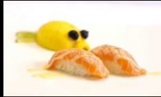
070. NIGIRI SAKE SCOTTATO