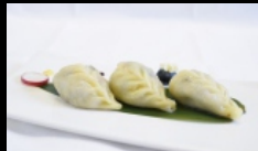
005. RAVIOLI VEGETARIAN