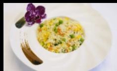
124. RISO CON VERDURE riso saltato con verdure misto € 3.50