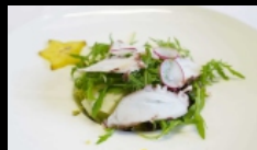
017. INSALATA DI POLPO