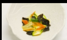
181. VERDURE MISTE verdure misto di stagione saltato € 3.50