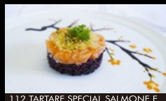
112. TARTARE SPECIAL SALMONE E PISTACCHIO tartare di salmone, riso venere, philadelphia, con pistacchio e salsa teriyaki € 8.00