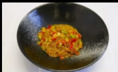
132. SPAGHETTI DI SOIA CON PICCANTE spaghetti di soia saltati con carne di maiale e salsa piccante € 3.50