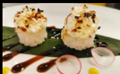
100. GUNKAN SNOWBALL .... € 4.50