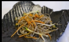
137. KAISEN YAKI SOBA spaghetti di grano saraceno saltati con verdure e uova, guarnito con granelle di arachidi € 4.00