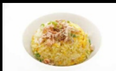
118A. RISO SAKE riso saltato con salmone, carote, zucchine, erba cipollina e uova € 3.80