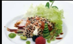
116. TATAKI SAKE fettine di salmone con sesamo alla piastra conditi con salsa teriyaki € 10.00