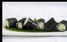
083. HOSOMAKI PHILADELPHIA farcito con philadelphia