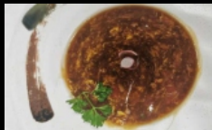
026. ZUPPA AGROPICCANTE

zuppa agro-piccante con verdure ,tofu, uova,pollo e cipollino