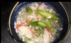
025A. ZUPPA CON ASPARAGI