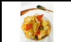
166. POLLO THAI petto di pollo saltato con salsa piccante € 4.00