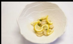
165. POLLO AL LIMONE petto di pollo saltato con limone e salsa al limone € 4.00