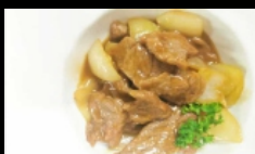
171. MANZO CON ZENZERO E CIPOLLOTTI manzo saltato con cipollotti e zenzero € 5.00