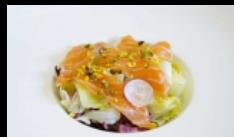
018. INSALATA SAKE