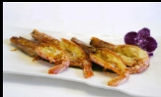
154. GAMBERONI ALLA GRIGLIA

gamberoni alla griglia conditi con salsa teriyaki