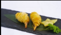
143. GAMBERI AVVOLTI IN PATATE