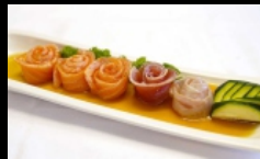
108. CARPACCIO MISTO SCOTTATO fettine di salmone, tonno, branzino scottato con salsa ponzu e sesamo € 12.00