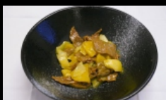
170. MANZO AL CURRY bocconcini di manzo saltati con curry € 5.00