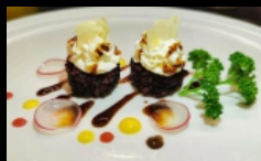
101. GUNKAN SPECIAL BALL .... € 4.50