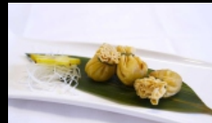
004. VEGETARIAN FORTUNE BAG