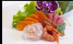
101. SASHIMI MISTO pesce misto € 15.00