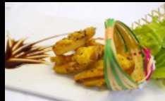
153. TOAST CON GAMBERI