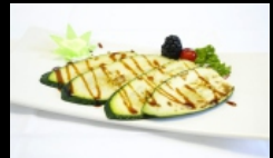
155A. ZUCCHINE ALLA GRIGLIA