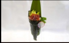
088. TEMAKI MAGURO farcito con tonno, avocado e sesamo