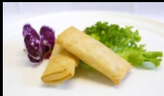
001. INVOLTINO PRIMAVERA