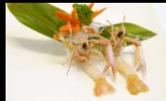
101A. SCAMPI scampi € 7.00