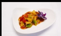
178. GAMBERI AGRODOLCE gamberetti saltati con ananas e salsa agrodolce € 5.00