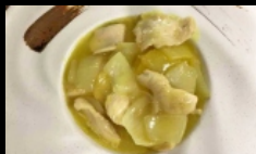
162. POLLO AL CURRY petto di pollo saltato con curry € 4.00