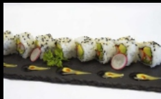
029. URAMAKI CALIFORNIA

rolli di riso farciti con granchio,avocado, cetrioli,sesamo