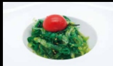
014. GOMA WAKAME